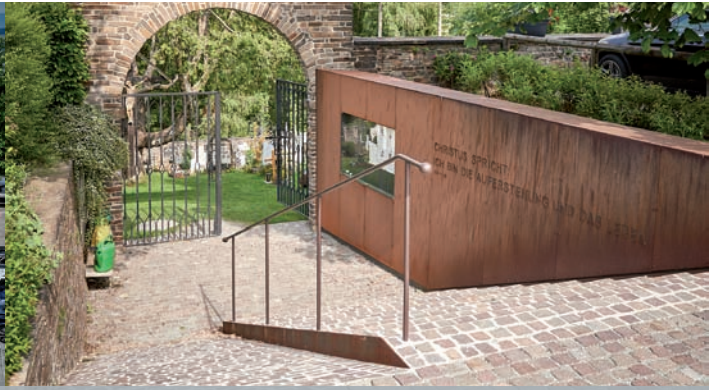
Dorfplatzgestaltung Gemeinde Pöllauberg