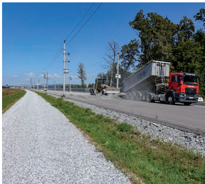
Bahnschotter für die ÖBB

An dieser Stelle möchten wir uns auch bei allen Einsatzorganisationen und dem Kriseninterventionsteam für die Hilfe und Unterstützung bedanken.