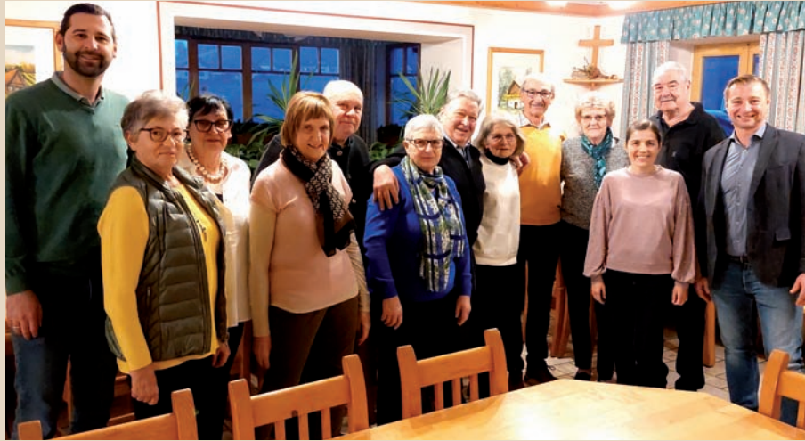
Gute Stimmung bei der Feier unserer Geburtstagskinder, die im zweiten Halbjahr 2023 ihren 70. bzw. 75. Geburtstag feierten.